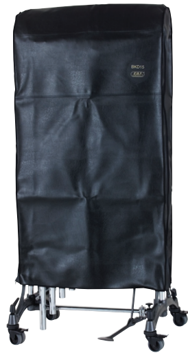
Cover | Hülle